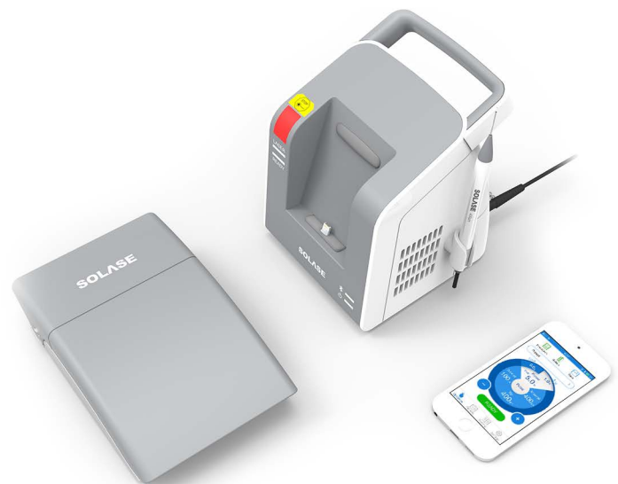
Laser Diode 16 Watts connection wifi via votre portable