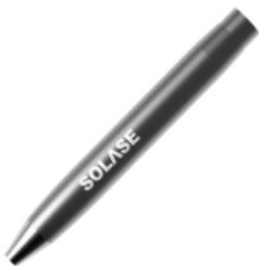
Pièce à main en fibre écologique