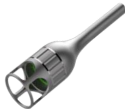
Pièce à main de thérapie