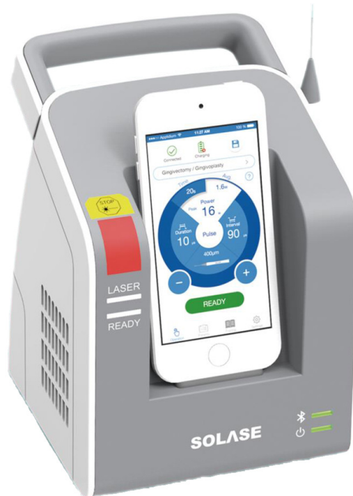
Laser Diode 16 Watts avec écran ipod 32Go ou 128 Go