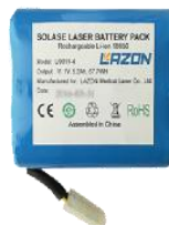
Batterie rechargeable li-ion (installée)