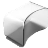
Bouclier blanchissant jetable 4pcs