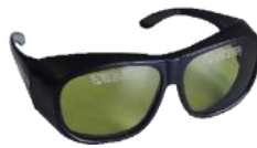
Lunettes de protection laser (2 pièces)