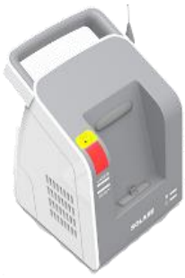
Unité de base