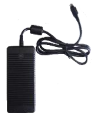
Alimentation CC avec cordon