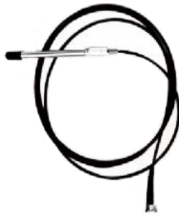
Corps pièce à main