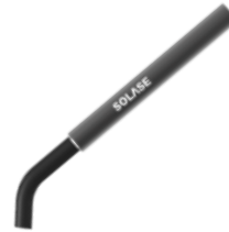
Pièce à main de biostimulation